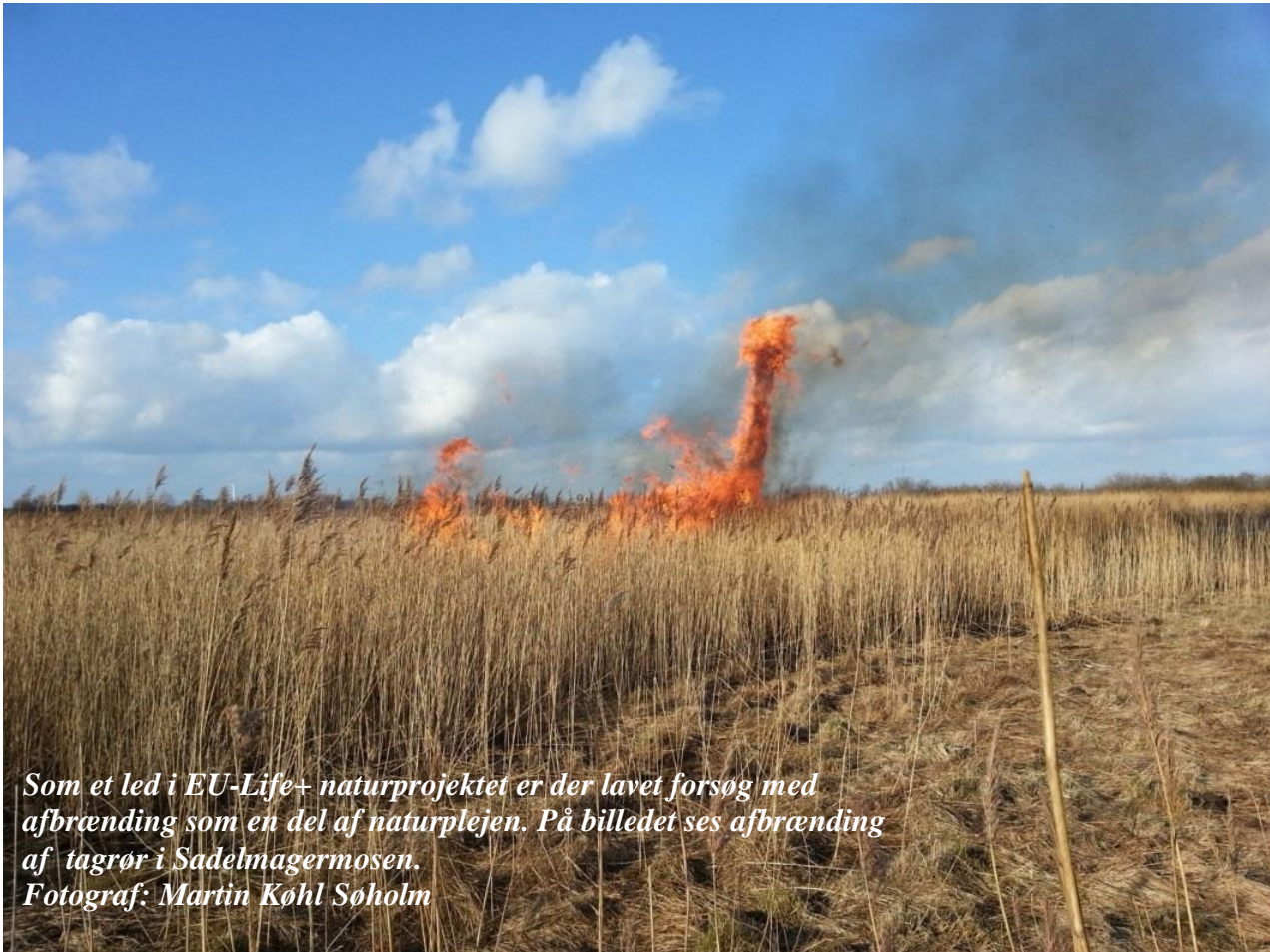
Som et led i EU-Life+ naturprojektet er der lavet forsøg med afbrænding som en del af naturplejen. På billedet ses afbrænding af tagrør i Sadelmagermosen.