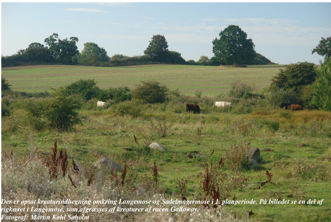
Der er opsat kreaturindhegning omkring Langemose og Sadelmagermose i 1. planperiode. På billedet se en del af rigkæret i Langemose, som afgræsses af Kreaturer af racen Galloway.

I perioden 2012-2018 er der gennemført et EU-Life naturprojekt www.life70.dk . Formålet med projektet er forbedre naturplejen i rigkærene i Lange Mose og Sadelmager Mose, som ligger ved Måle Strand.