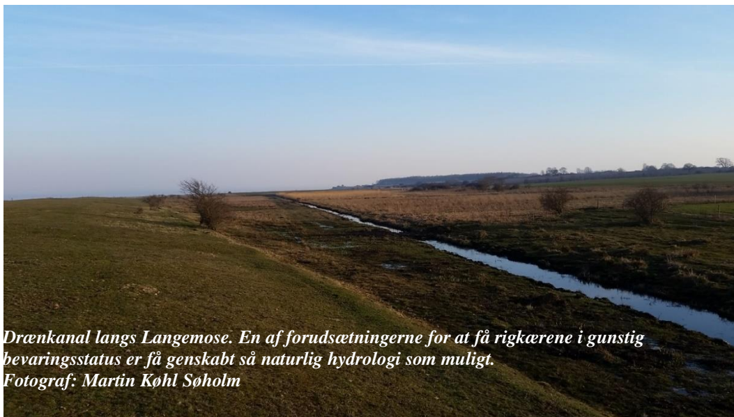
Drænkanal langs Langemose. En af forudsætningerne for at få rigkærene i gunstig bevaringsstatus er få genskabt så naturlig hydrologi som muligt.