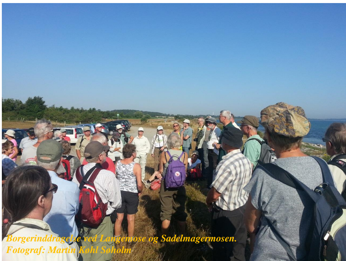
Borgerinddragelse ved Langemose og Sadelmagermosen.

Projekterne gennemføres ved frivillige aftaler, og derfor er det i mange tilfælde ikke på nuværende tidspunkt muligt at beskrive hvornår projekterne fysik bliver udført. Kommunen vil i hvert enkelt tilfælde sørge for, at relevante interessenter bliver inddraget.